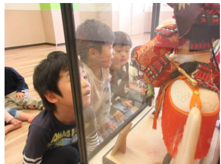
五月人形にも興味津々。

5月3日、子供の日の集いを行いました。絵本を通じて意味を学ぶ子供たち。真剣にお話を聞きました。